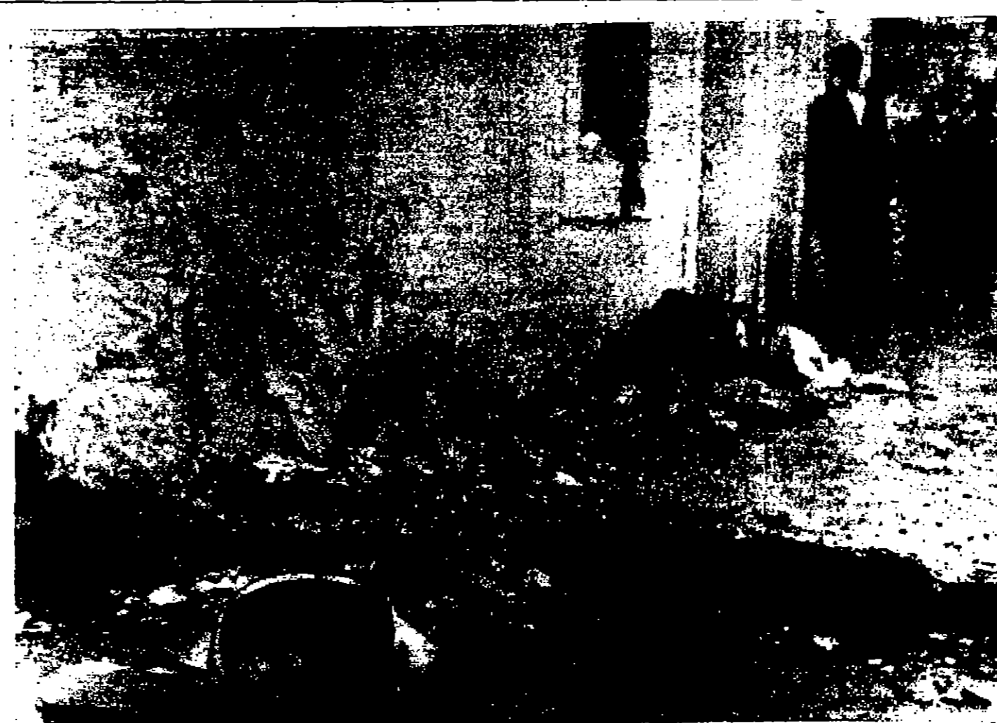
مشهد لثار الدمار الذي خلفه العدوان الاسرائيلي القاسم على ترحيله القنينة يوم الأحد المملسي

بعد ساعات من وصول غريشكو الى براغ - رويتر - ذكرت وكالة اتباه سنجكا التشيكية ان المستر الكسفي كوسيفين رئيس الوزراء السوفياتي وصل الى هانديعة من الرئاسة المركزية للحزب الشيوعي التشيكوسلوفاكي والحكومة - وقد وصل المستر كوسيفين الى براغ بعد ساعات قليلة من وصول المرشال اندريه غريشكو وزير الدفاع السوفياتي الى العاصمة التشيكية على رأس وفد سوفييتي عسكري رفيع - ورحب الضرال دوزور والمستر جوزيف لينتريت سكرتير اللجنة المركزية للحزب الشيوعي في مطار براغ بلقود الذي هم الضرال الكسفي بيبيشيف رئيس الادارة السياسية الرئيسية في الجيش السوفييتي - وشملت وكالة اتباه سنجكا التشيكوسلوفاكية ان الفيلة الروسية من زيارة وفد وزارة الدفاع السوفياتية تقصر على التعريف على قيادة الجيش التشيكوسلوفاكي وعلى تبادل الضربات وتناول قضايا تم الجاقين بالبحث والفراسة - واقترب مراسل رايو براغ من البقية على الصفحة السادسة عمود ٥